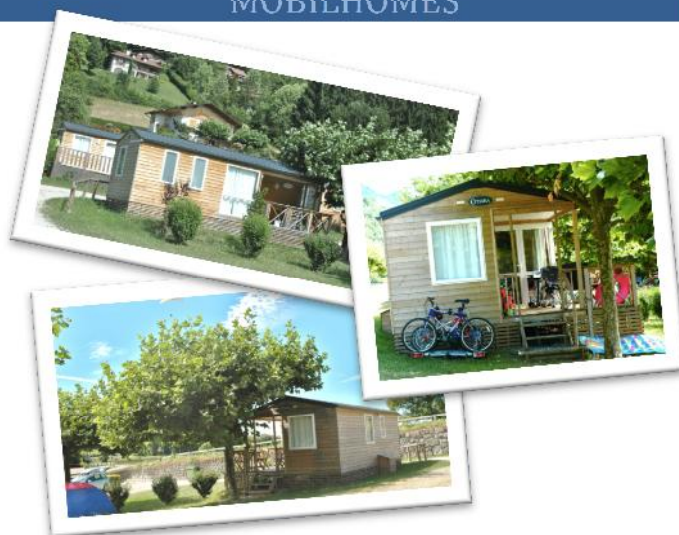
Mobilhomes 2 personnes – 15,5m 2