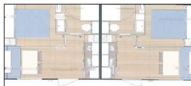
Mobilhomes 4 à 6 personnes – 29,2m 2